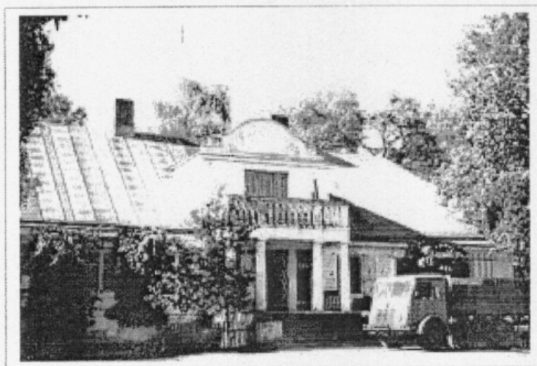
Dworek w Żerominie – fotografia z lat 60